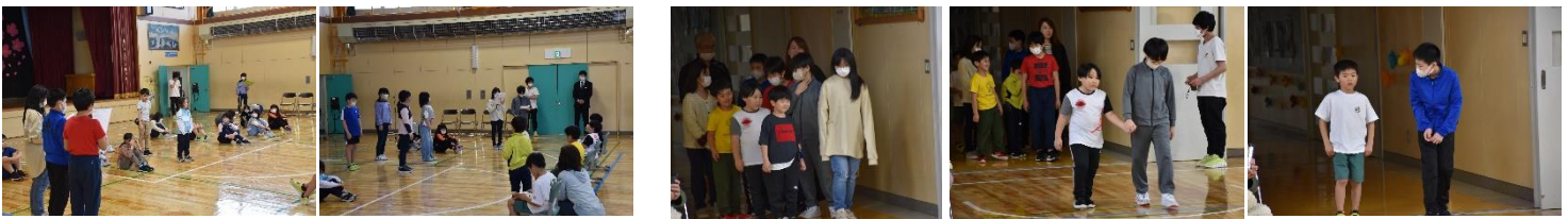
ファミリー班紹介。半年間の縦割り活動のメンバーをみんなで確認しました。