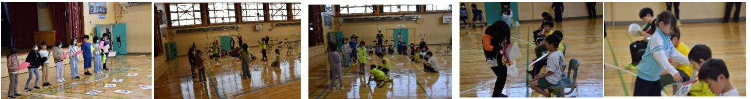
3・4年生の学級発表は、先生方の紹介「カルタ」。1年生にとってもらうようにしていました。2年生からはプレゼント贈呈

学級発表では、1年生を楽しませよう、これからの学校生活を安心して過ごしてほしい、という上級生の温かな、優しい雰囲気にも包まれたものとなりました。また、1年生も「ありがとう」の気持ちをしっかり表し、全員がまとまって過ごすことができました。これからも全員で力を合わせて、たくさんのごことに取り組んでいってほしいと思います。