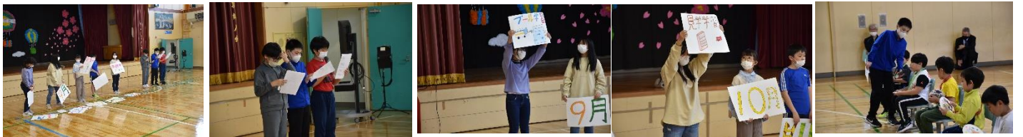
5・6年生の学級発表は、「1年間の行事紹介」。クイズを交え、1年生に答えてもらうようにしました。(全問正解！)