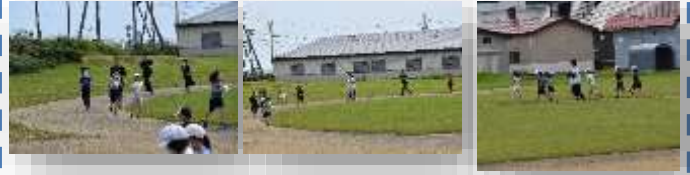
マラソン大会 9月9日(木) 11:20～ 雨天延期16日(金)

9月8日(木)マラソン大会を行います。体力作りの一環として、毎日の中休み、昼休みにグラウンドを走って練習に励んでいます。当日は、力強く走りきれよう頑張ります。