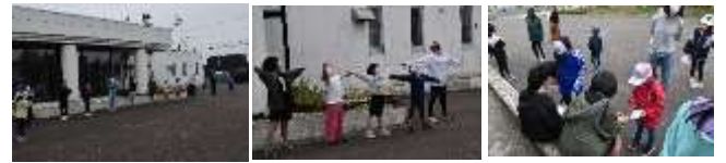
ラジオ放送に合わせた時間を実施しました(6時30分)

7月25日(月)からの3日間、子ども育成会の皆様による「夏休みラジオ体操」が行われました。長期休みの始まりに行くことで、生活リズムを意識して過ごすために大切な活動となりました。お忙しい中、ありがとうございました。