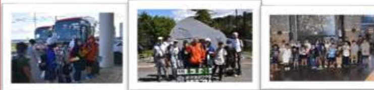
出発 旭山動物園 科学館(参加者全員)

8月24日(水)～25日(木)に、旭川への修学旅行を実施しました。子どもたちは、修学旅行の目的を意識した集団行動ができていました。大きな事故やけが、病気もなく、2日間楽しんで活動し、思い出に残る修学旅行となりました。6年生の保護者の皆様、これまでの準備等、ありがとうございました。