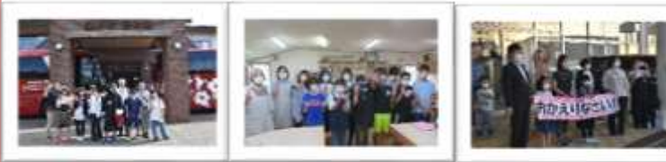
ホテル花神楽 自主研修(大雪窯) 到着

【行程】(1日目) 猿払村出発→旭山動物園→旭川市科学館「サイパル」→森の湯ホテル花神楽(2日目) 体験活動(大雪窯、鈴木工房、近藤染工場)→自主研修(昼食含む)→旭川出発→猿払村到着